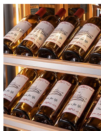
CLAYETTE DE PRÉSENTATION

Apportez un encombrement réduit dans les cuisines avec des ouvertures de porte de 30 cm