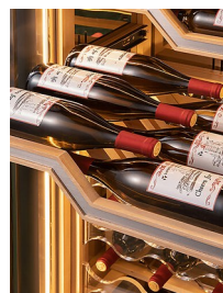
CLAYETTE LABEL VIEW

Pour une mise en valeur de vos plus belles bouteilles en position verticale